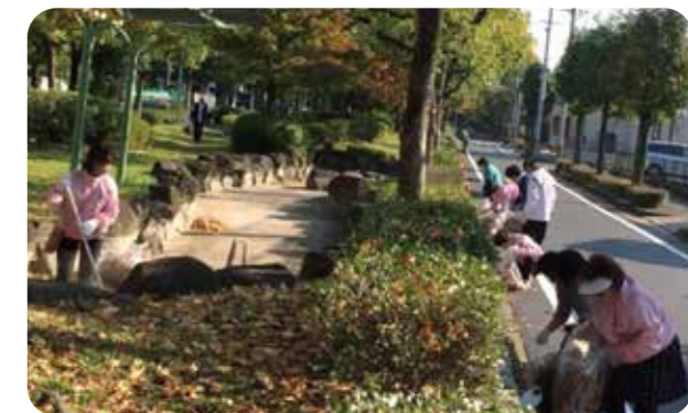
姉妹都市市民の会と共にケローナ通りを清掃活動