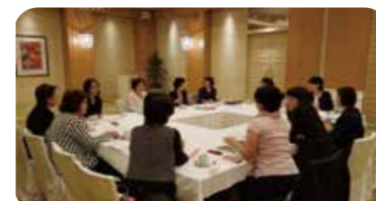
大会委員会では活発に意見交換